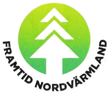
Föreningen Framtid Nordvärmland

Den 8 februari beslutades att bifalla en ansökan från Föreningen Framtid Nordvärmland. Bidraget som skall tas ur Minnesfonden skall användas som föreningens startkapital.